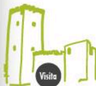
"Castillo Doña Berenguela"